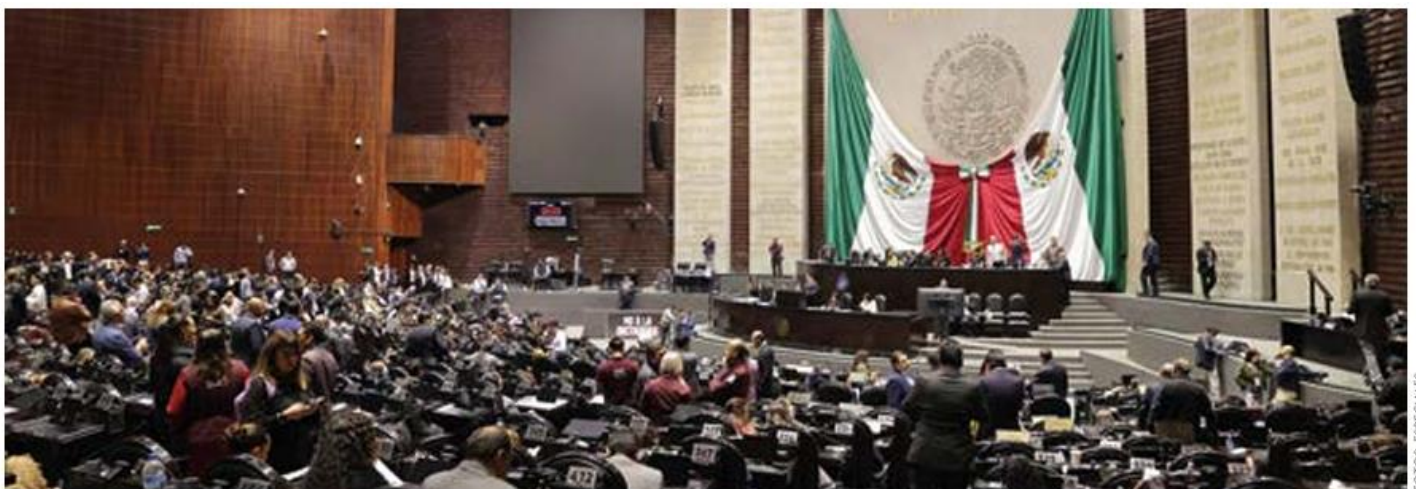
Sesión. La discusión en el pleno de la Cámara de Diputados sobre el plan B duró más de 14 horas.

y 124 en contra recibió el plan B de Claudia Sheinbaum en el pleno de San Lázaro.