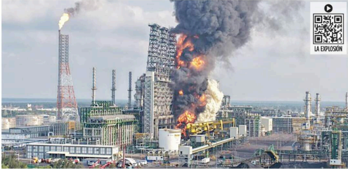
■ La explosión en la refinera de Dos Bocas ocurrió en una bodega de coque y oficialmente no se reportaron lesionados.