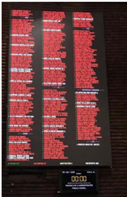
Votación. El plan B se aprobó la madrugada de ayer en San Lázaro, con 343 votos a favor y 124 en contra.

En San Lázaro lo debatieron 14 horas y en Tabasco, el primero en aprobarlo, 10 minutos