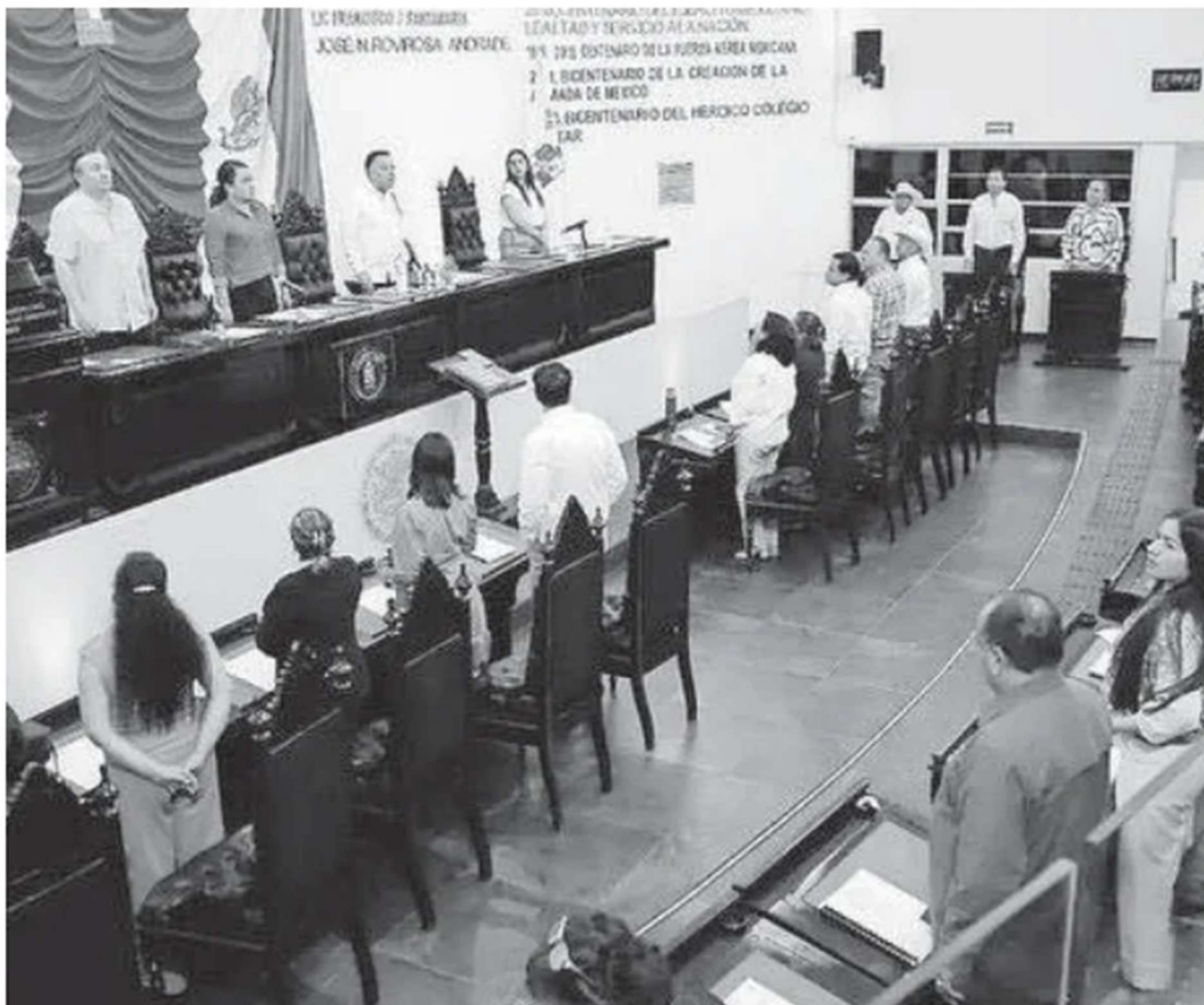
El congreso de Tabasco fue el primero en avalar el plan B de Sheinbaum