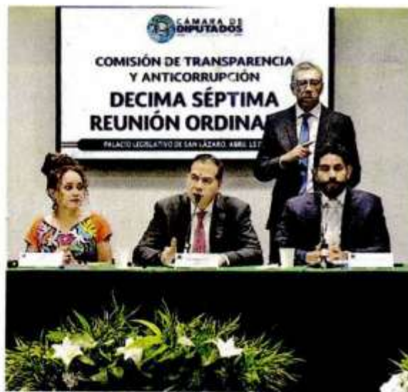
Los legisladores afirmaron en el debate que la celeridad del dictamen responde a la urgencia de combatir la corrupción.

Se prevé castigo a funcionarios que acepten injerencias políticas en el ejercicio de sus funciones; establece la creación de la figura de "auditorías especializadas", con la obligación de que el personal esté certificado, y crea el Registro de Información y