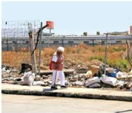
El malestar vecinal es constante ante las carencias estructurales que se viven en este municipio del Estado de México.

de infraestructura social en zonas con rezago, presenta más de 207 millones de pesos sin respaldo documental.