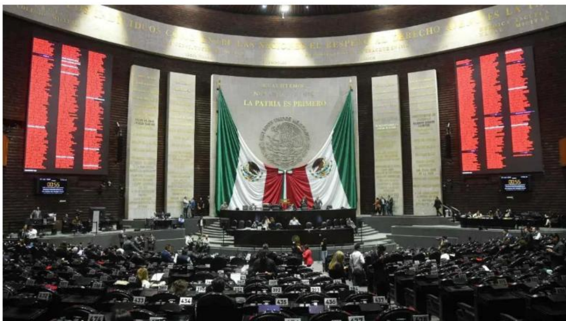
Diputados avalan, por unanimidad, la reforma para dar facultad a la ASF para investigar.