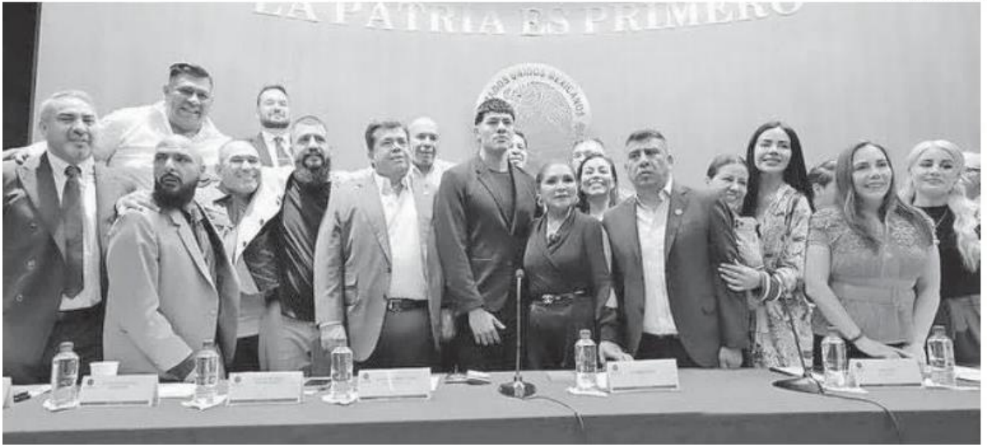
El cantante (al centro) se reunió con legisladores