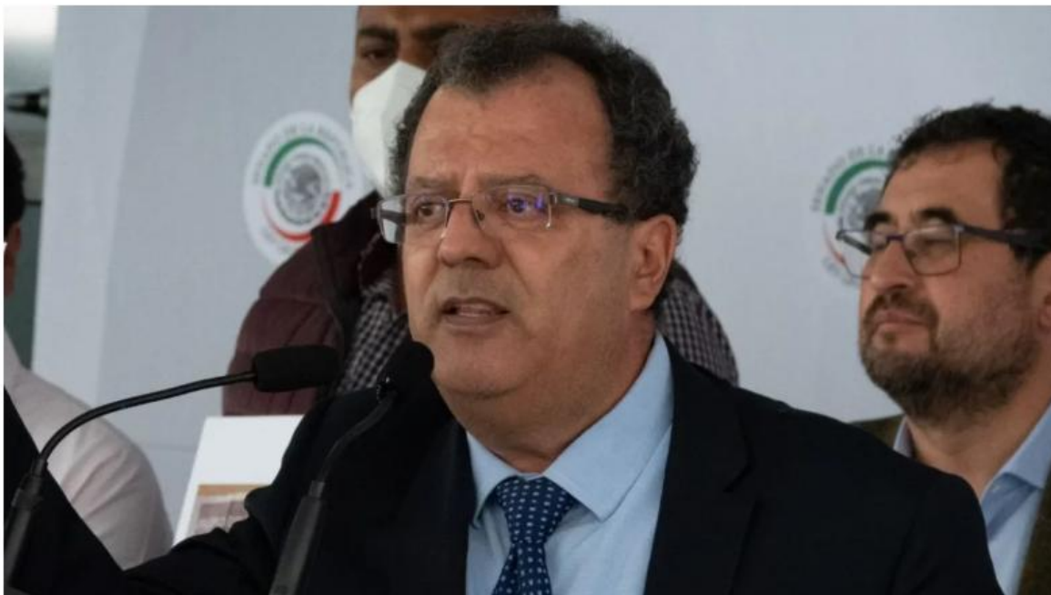
Gilberto Herrera, diputado de Morena, denunció a la CATEM por presunto fraude de 100 mdp y a Pedro Haces por supuestas amenazas.

“Seguiremos defendiendo a la gente, hay un fraude que se cometió a varios trabajadores trabajadores de la educación y a los pensionados del IMSS, y está involucrado, y las amenazas que él me haga, en el sentido de que él no intervenga en ello, no las voy a tolerar ni las voy a permitir tal como se lo dije”, sentenció.