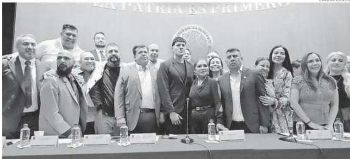
El cantante (al centro) se reunió con legisladores