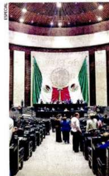
La reforma fue avalada por 440 votos a favor del dictamen en la Cámara de Diputados.

Por 440 votos a favor, los diputados aprobaron el dictamen de la reforma a la Ley Federal del Trabajo y la Ley del Seguro Social para definir que los trabajadores del campo son las personas que realizan labores dirigidas a la obtención de alimentos o productos primarios con la realización de diversas tareas siempre que éstas no sean sometidas a algún tipo de proceso industrial y se desarrollen en ámbitos rurales. ●