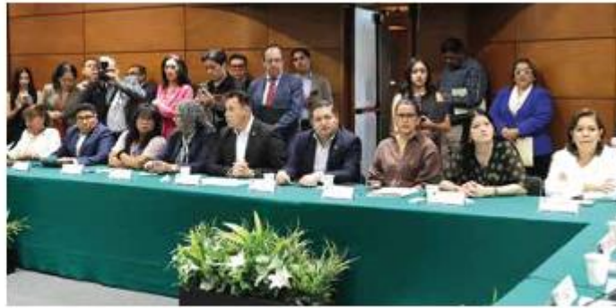
Votos. El dictamen fue aprobado por 390 votos a favor de todos los presentes.

En el artículo 17 de la Ley de Fiscalización y Rendición de Cuentas de la Federación, se establece que “la ASF tendrá acceso a la información que las disposiciones legales consideren como de carácter ‘reservado’ o ‘confidencial’, cuando esté directamente relacionada con la captación, recaudación, adminis-