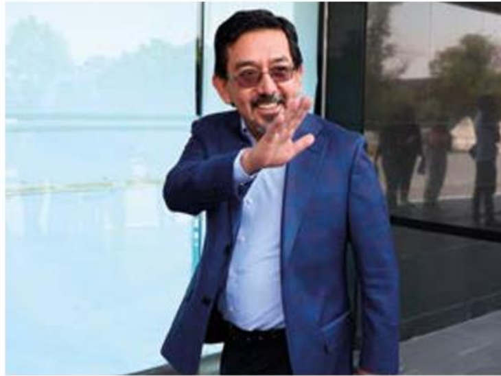
Postura. Chávez cuenta como parte de su experiencia el haber sido funcionario de casilla.

Al salir de su entrevista con el Comité Técnico de Evaluación que conduce el proceso de selección, Chávez explicó que su experiencia electoral incluye la coordinación del primer monitoreo de medios de comunicación que el otrora Instituto Federal Electoral encargó a la Facultad de Ciencias Políticas y Sociales, haber