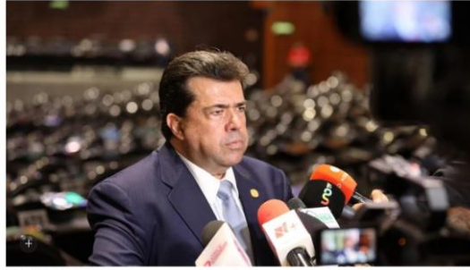
El diputado federal Pedro Haces Barba. Cortina

El diputado federal señaló que las reformas legales deben ir acompañadas de una visión más amplia sobre el futuro del trabajo. "México necesita un sistema laboral que proteja derechos, pero que también funcione", dijo.