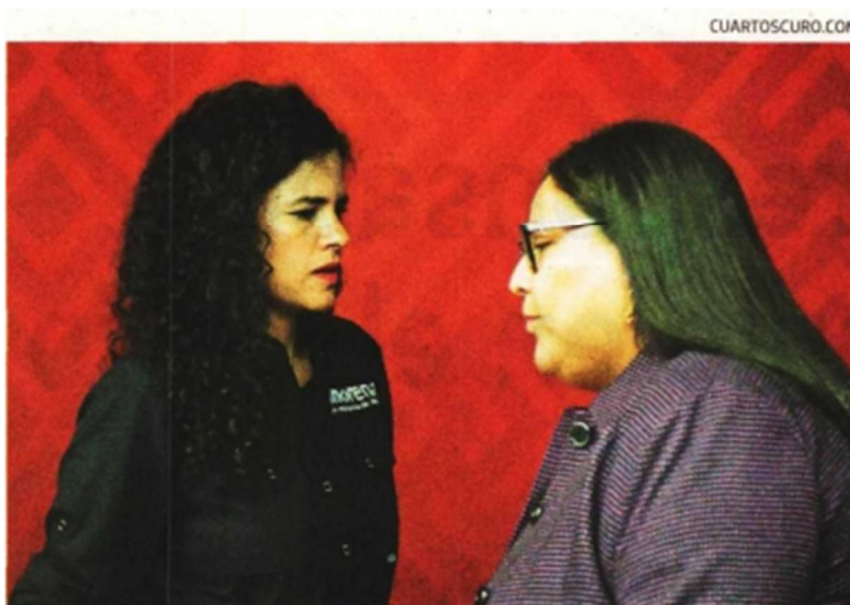
Luisa María Alcalde y Citlalli Hernández, ayer.