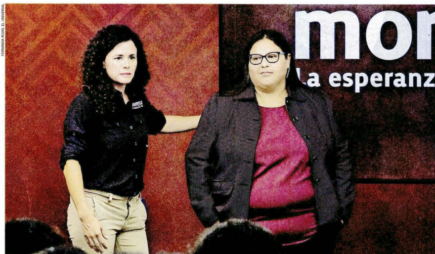
Luisa María Alcalde afirmó que la incorporación de Citlalli Hernández es fundamental para fortalecer al partido e impulsar los acuerdos entre Morena, PVEM y PT.

Vamos a un 2027 a mantener nuestros gobiernos estatales, a mantener nuestra mayoría calificada, a fortalecer nuestro partido, la unidad”