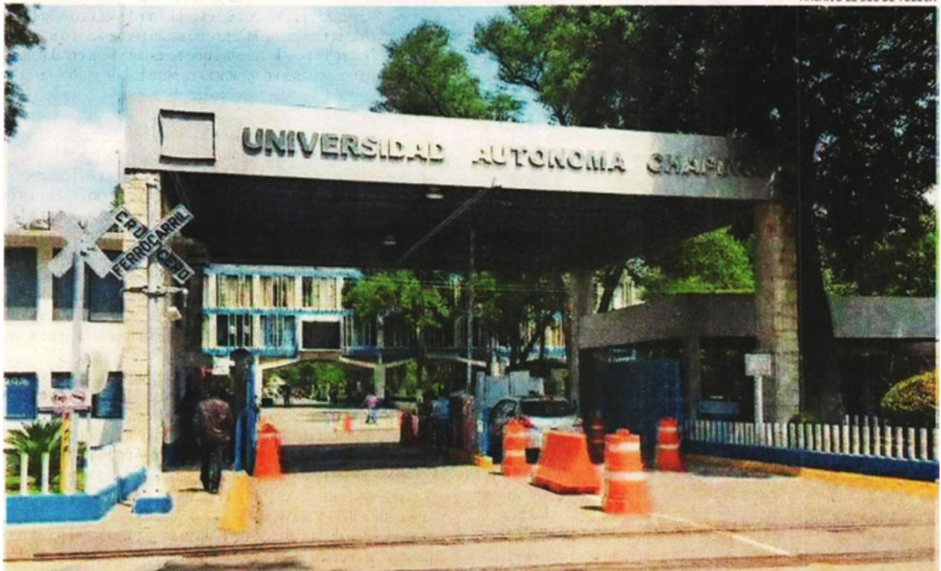
Fachada de la Universidad Autónoma de Chapingo