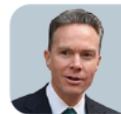
JAVIER CORRAL Senador de Morena

YO LO VEO positivo (que se difiera). Yo creo que da más tiempo para que exista una mayor organización y yo creo que sería bueno que se pudiera llevar a cabo en el 2028. Hay cosas que son perfectibles"