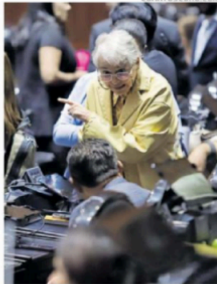
Olga Sánchez Cordero , exministra y diputada de Morena.

Promedios académicos mínimos o cartas de recomendación son insuficientes para evaluar objetivamente, señalan.