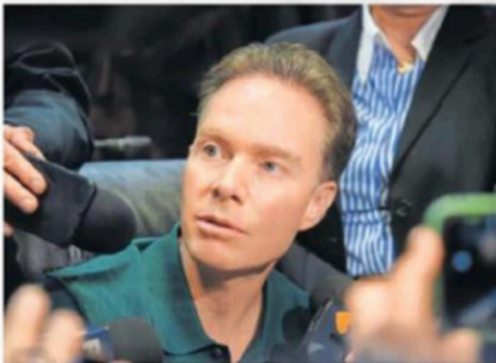
Manuel Velasco dijo que el regreso de Citlalli Hernández a Morena es una noticia muy bien recibida, ya que facilita acuerdos en la alianza.