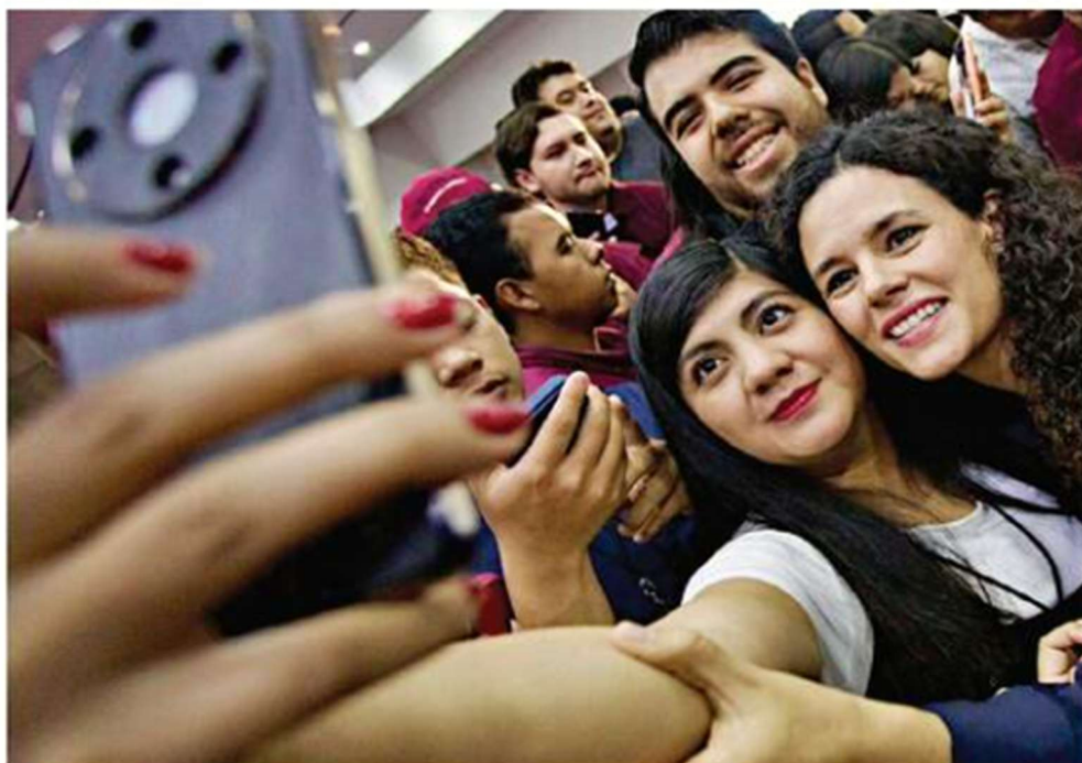
■ La dirigente morenista Luisa María Alcalde asistió al encuentro con jóvenes realizado en Monterrey.