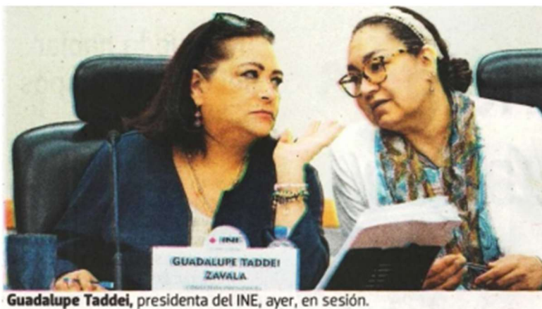
Guadalupe Taddei, presidenta del INE, ayer, en sesión.

Es decir, lo nuestro son temas operativos y logísticos y de recursos”