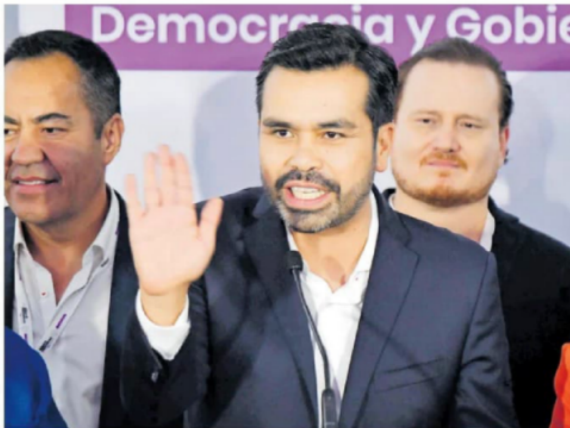
Jorge Álvarez Máynez , dirigente nacional de Movimiento Ciudadano.