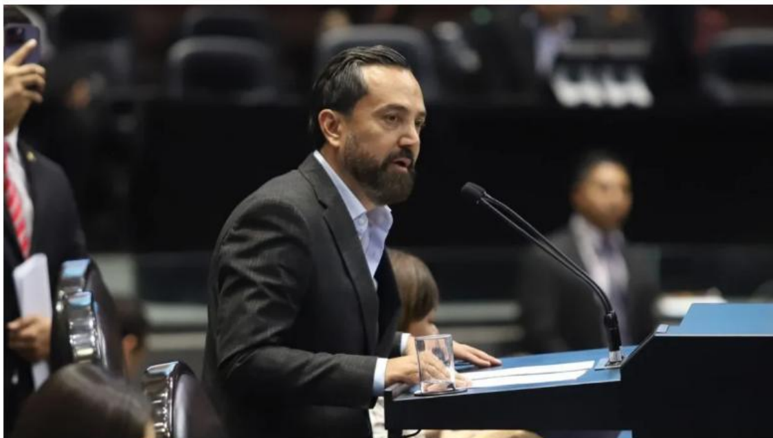
'Yo no meto las manos al fuego por nadie': Arturo Ávila, vocero de Morena en San Lázaro, en relación al caso Rocha Moya.